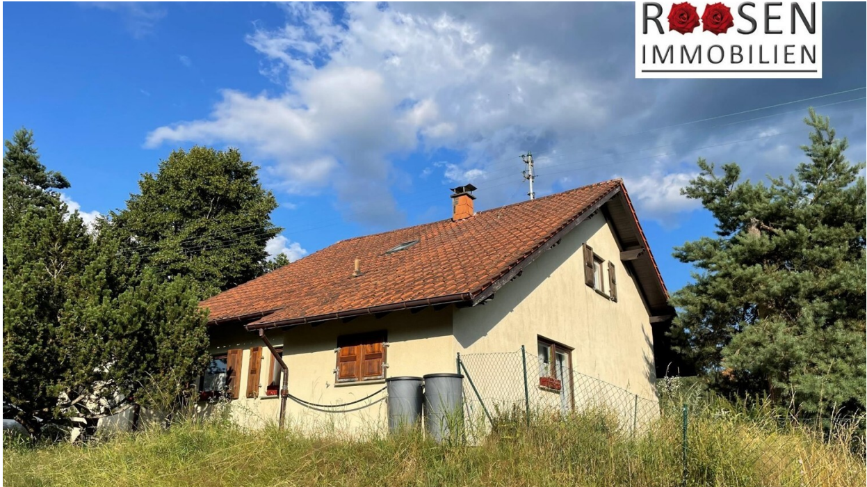
Hofstätten_EFH_Ferienhaus_Startbild mit Logo-1