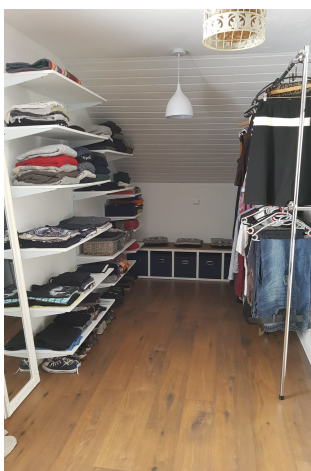
Ankleide_gr. Schlafzimmer OG